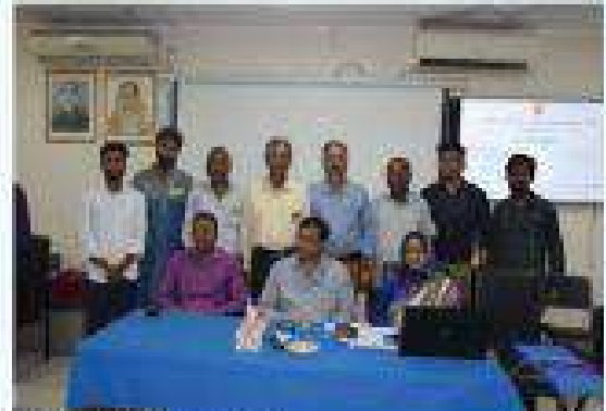
চিত্র: ২০২১-২০২২ অবসরকালে পরিচালিত বিভিন্ন কোর্সের ছবি।