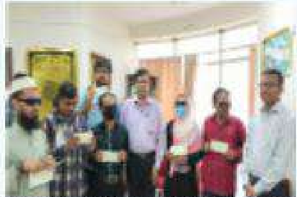
চিত্র - বাংলাদেশ জাহাঙ্গীর সনাতনকল্যাণ পরিদেয় সিন্দাই পর্ষদ জ্ঞানম মোহাম্মদ জলিন উলিন সনাতনকল্যাণ পরিদেয় সিন্দাই পর্ষদ জ্ঞানম মোহাম্মদ জলিন উলিন।