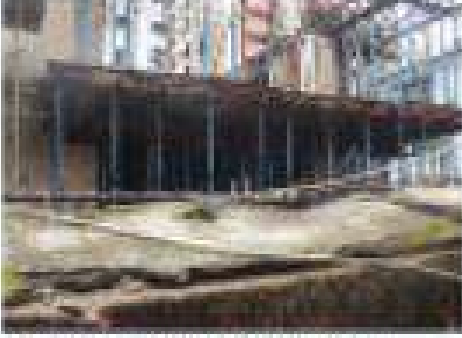
চিত্র। সমাজকল্যাণ ভবন নির্মাণ কাজ চলমান।