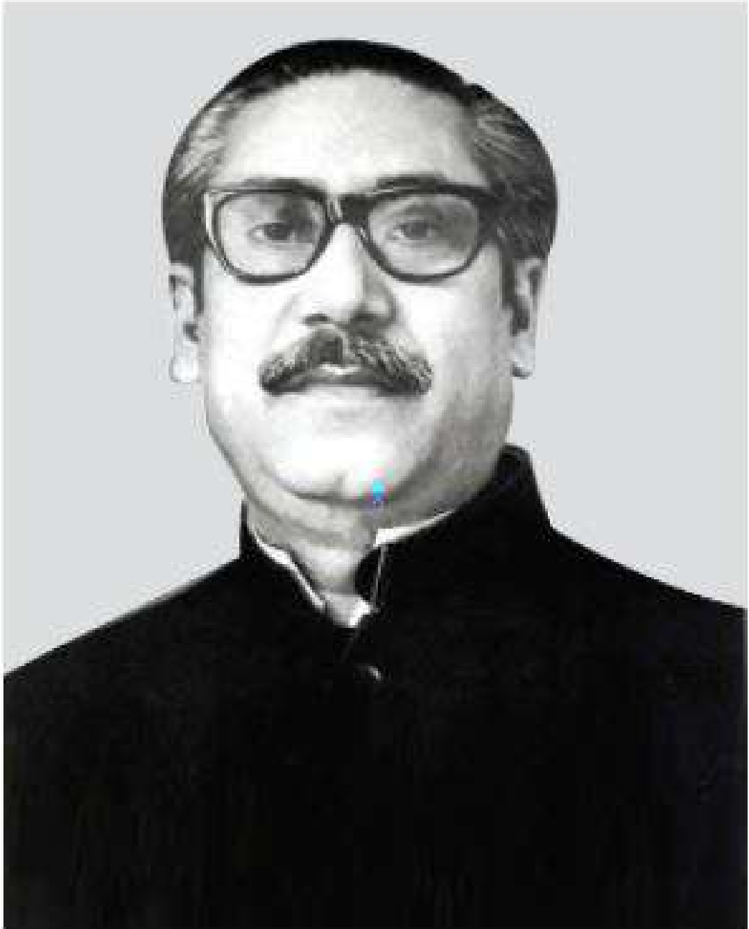
জাতির পিতা বঙ্গবন্ধু শেখ মুজিবুর রহমান