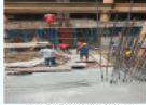
চিত্র। সমাজকল্যাণ ভবন নির্মাণ কাজ চলমান।