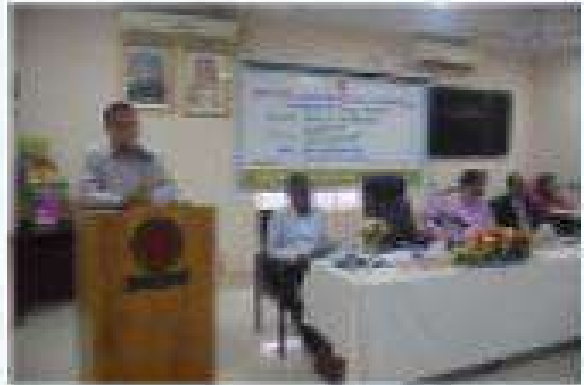
চিত্র - বাংলাদেশ জাতীয় সমাজকল্যাণ পরিষদ কর্তৃক জাতীয় পর্যায়ে প্রতিষ্ঠানের অসুকুলে এনস অসুলানের সুলন পর্যালোচনা শীর্ষক সেমিনারে বক্তব্য রাখছেন সমাজকল্যাণ সন্ত্রশকয়ের সারকীয় পরিদ জগদীশ হান জাতীয় সালন