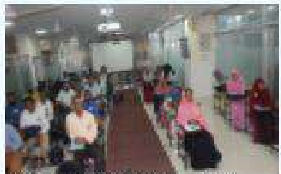
প্রশিক্ষণ কোর্সে অংশগ্রহণকারী প্রশিক্ষণার্থীদের একগুণে।