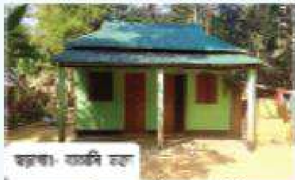
চিত্র- চা বাগান শ্রমিকদের আবাসন নির্মাণ