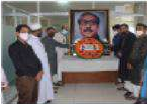
চিত্র: ১৫ আগস্ট ২০২১ খ্রি. জাতীয় শোক দিবসে বসবস্তু শেখ মুজিবুর রহমান এর প্রতিবন্ধ পূর্ণায়ন কর্মসূচীতে তাঁর প্রতিবন্ধিত্ব পূর্ণায়নকে অর্পণ করা হয়।

বাংলাদেশ জাতীয় সমাজকল্যাণ পরিষদের উদ্যোগে জাতীয় শোক দিবস-২০২১ উদযাপন করা হয়। এ উপলক্ষে বাংলাদেশ জাতীয় সমাজকল্যাণ পরিষদ কার্যালয়ে বসবস্তু শেখ মুজিবুর রহমান এর প্রতিবন্ধিত্ব পূর্ণায়নকে অর্পণ, আলোচনা সভা ও সোহা নার্কিস অকুটিক হয়। এছাড়াও নৃত্যরোপন করা হয়।