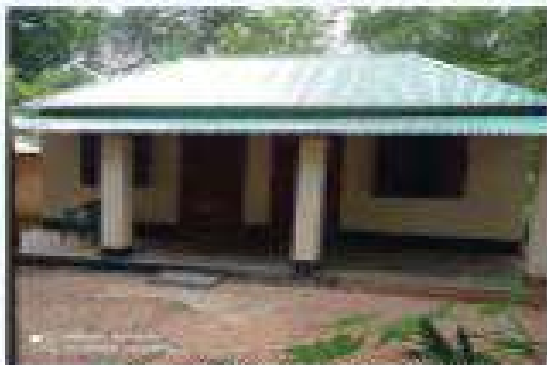
চিত্র- চা বাগান শ্রমিকদের আবাসন নির্মাণ