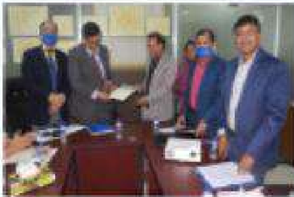
চিত্র- সারকটি গবেষণা প্রতিষ্ঠানের সাথে সুকিলানা সাকরিক হয়।

বাংলাদেশ জাতীয় সমাজকল্যাণ পরিষদ সমরে সমরে উচ্চ বিত্তীয় সামাজিক সমস্যার ঞ্চর জরিপ ও গবেষণা কার্যক্রম পরিচালনার জন্য সরকার পীকৃত একটি প্রতিষ্ঠান। ১৯৫৬ সালে পরিষদ পঠনের সময়ে গবেষণা কার্যক্রম পরিচালনার মাঝেই থাকলেও উপযুক্ত জনবলের অভাবে অশেষ অনেক কালের সাথে ওজনকুপূর্ণ এ সারিকুটি বখাবধতবে পালন করা সত্তব হয়নি, ২০২১-২০২২ অর্থবছরে বাংলাদেশ জাতীয় সমাজকল্যাণ পরিষদের অর্থাৎসে "বাংলাদেশ জাতীয় সমাজকল্যাণ পরিষদ কর্তৃক জাতীয় পর্যায়ে প্রতিষ্ঠানের অসুকুলে এনস অসুলানের সুলন পর্যালোচনা, সরকারের সামাজিক শিরাপত্ত কর্মসূটির সুল্যায়ন, প্রতিবন্ধী সেবা ও সাহায্য কেন্দ্র থেকে প্রতিবন্ধী ব্যক্তি বা প্রতিবন্ধিকার সুকিতে থাকা সক্তিবর্গকে সেবা এলাদ, সকুল শকুল মানক সামরীয় ঊপস, সরবরাহ, ব্যবহারকারী, সামাজিক এতাব ও ঊন্তরণের ঊপায়, সমাজসেবা অধিদপ্তর কর্তৃক পরিচালিত পট্টী সমাজসেবা কার্যক্রম (আরএলএস) সারিক বিসোর্চনের অসাকম মনস, জেলা সমাজকল্যাণ কমিটিকে এনস অসুলান শিরিক/জরিপ, স্করীয় শিরের জনশোঠীকে শিরে সরকারের কার্যক্রম সুল্যায়ন" শীর্ষক সারকটি গবেষণা সম্পন্ন হয়েছে।