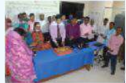
চিত্র: ১৭.০৫.২০২২ অত্রিক জাতীয় শোক দিবসে বসবস্তু শেখ মুজিবুর রহমান এর উদ্দেশ্য কর্মসূচীতে তাঁর প্রতিবন্ধিত্ব পূর্ণায়নকে অর্পণ করা হয়।