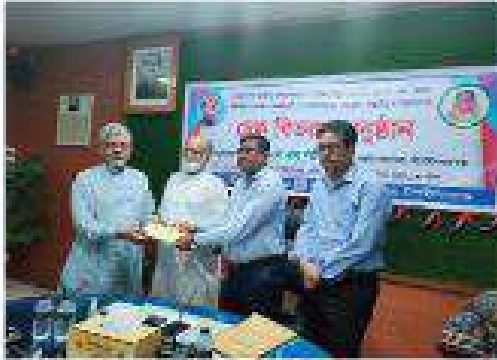
চিত্র: প্রোগ্রাম বিতরণ কার্যক্রমে শেজাকোশা থেকে এসে পরিচয় খান, জেলা প্রশাসক, হাটহাটসহায়ক