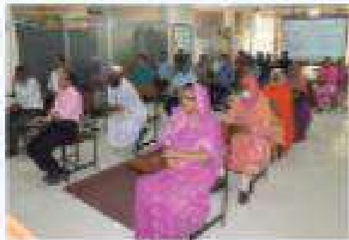
চিত্র: ১৭.০৫.২০২২ অত্রিক জাতীয় শোক দিবসে বসবস্তু শেখ মুজিবুর রহমান এর উদ্দেশ্য কর্মসূচীতে তাঁর প্রতিবন্ধিত্ব পূর্ণায়নকে অর্পণ করা হয়।