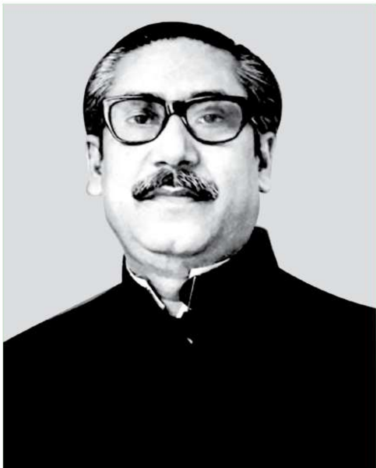
জাতির পিতা বঙ্গবন্ধু শেখ মুজিবুর রহমান