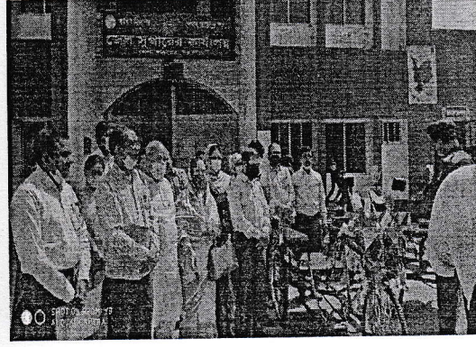
চিত্র: ৪ নওগাঁ জেলায় বিকল্প কর্মসংস্থান

একনজরে স্বাধীনতার সুবর্ণজয়ন্তী উদযাপন উপলক্ষ্যে বাংলাদেশ জাতীয় সমাজকল্যাণ পরিষদের গৃহীত কর্মসূচির বাস্তবায়ন/ অগ্রগতি প্রতিবেদন