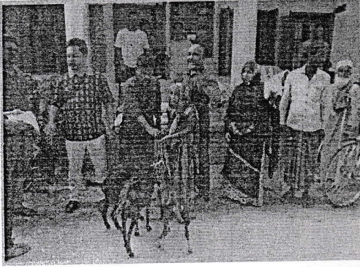
চিত্র : ৩ রাজবাড়ী জেলায় ভিক্ষুক পুনর্বাসন

নিয়মিত বাজেট বরাদ্দ হতে ৪৯টি জেলায় জেলা সমাজকল্যাণ কমিটির মাধ্যমে ১০৮জন ভিক্ষুককে ভিক্ষাবৃত্তি নিরসন ও বিকল্প কর্মসংস্থানের ব্যবস্থা করার জন্য বরাদ্দ প্রদান করা হয়। জেলা সমাজকল্যাণ কমিটি কর্তৃক বরাদ্দকৃত অর্থে ইতোমধ্যে ১০০ জনের অধিক ভিক্ষুককে বিকল্প কর্মসংস্থানের মাধ্যমে পুনর্বাসন করা হয়েছে। নিচে গৃহীত কার্যক্রমের চিত্র দেয়া হলো:-