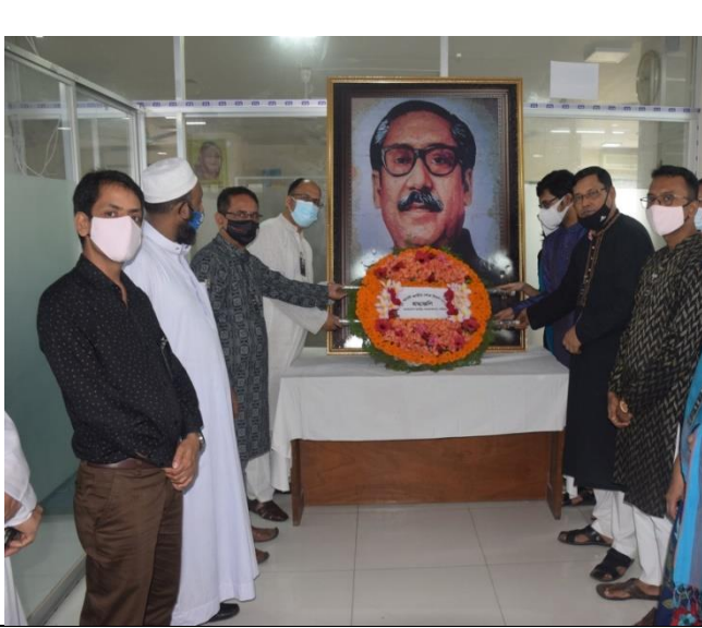
১৫.০৮.২০২১ তারিখ জাতির পিতা বঙ্গবন্ধু শেখ মুজিবুর রহমান এর ৪৬তম শাহাদত বার্ষিকীতে তাঁর প্রতিকৃতিতে পুষ্পস্তবক অর্পন করা হয়।

বাংলাদেশ জাতীয় সমাজকল্যাণ পরিষদের উদ্যোগে জাতীয় শোক দিবস-২০২১ উদযাপন করা হয়। এ উপলক্ষে বাংলাদেশ জাতীয় সমাজকল্যাণ পরিষদ কার্যালয়ে বঙ্গবন্ধু শেখ মুজিবুর রহমান এর প্রতিকৃতিতে পুষ্পস্তবক অর্পন, আলোচনা সভা ও দোয়া মাহফিল অনুষ্ঠিত হয়। এছাড়াও বৃক্ষরোপন করা হয়।