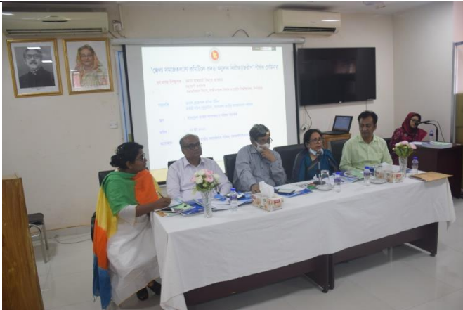
জেলা সমাজকল্যাণ কমিটি