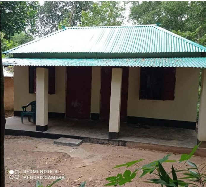
চিত্র : চা বাগান শ্রমিকদের আবাসন নির্মাণ