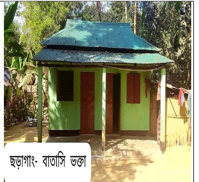
ছড়াগাং- বাতাসি ভঞ্জা