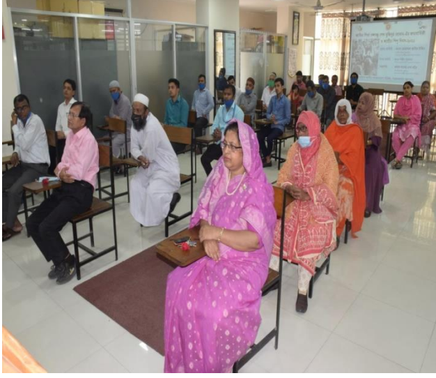
১৭.০৩.২০২২ তারিখ জাতির পিতা বঙ্গবন্ধু শেখ মুজিবুর রহমান এর জন্মশত বার্ষিকী উপলক্ষ্যে দোয়া ও আলোচনা সভার একাংশ।