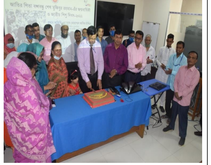
১৭.০৩.২০২২ তারিখ জাতির পিতা বঙ্গবন্ধু শেখ মুজিবুর রহমান এর জন্মশত বার্ষিকী উপলক্ষ্যে কেক কাটা অনুষ্ঠিত হয়।