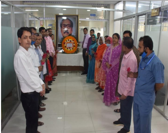
১৭.০৩.২০২২ তারিখ জাতির পিতা বঙ্গবন্ধু শেখ মুজিবুর রহমান এর জন্মশত বার্ষিকীতে তাঁর প্রতিকৃতিতে পুষ্পস্তবক অর্পন করা হয়।