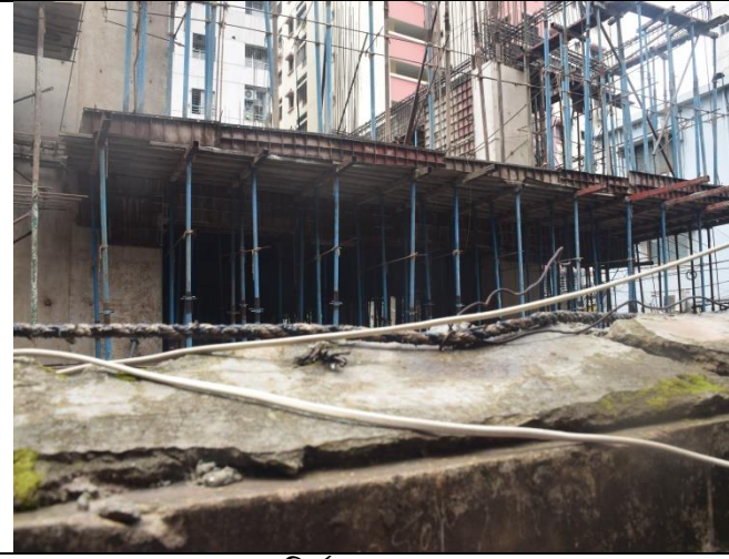
'সমাজকল্যাণ ভবন' নির্মাণের কাজ চলমান

৪.১ মাননীয় প্রধানমন্ত্রীর সানুগ্রহ অনুমোদনক্রমে ১৩২ নিউ ইন্সট্যান্ড দ্বিতল ভবন বিশিষ্ট ১১.৯৪ কাঠা জমি বাংলাদেশ জাতীয় সমাজকল্যাণ পরিষদের অনুকূলে বরাদ্দ দিয়েছেন হয়। পরিষদের অনুকূলে বরাদ্দকৃত জমিতে বহুতল বিশিষ্ট 'সমাজকল্যাণ ভবন' (১৫ তলা) নির্মাণের লক্ষ্যে গণপূর্ত অধিদপ্তর কর্তৃক প্রণীত ডিপিপি ২২ জুন, ২০২০ খ্রি. একনেক সভায় চূড়ান্ত অনুমোদিত হয়েছে। নিজস্ব জমিতে 'সমাজকল্যাণ ভবন' নির্মাণের কাজ চলমান রয়েছে। বর্তমানে ভবনের তিনটি বেসমেন্টসহ ৬ষ্ঠ তলার ছাদ ঢালাইয়ের কাজ শেষ পর্যায়ে। নিচে চলমান ভৌত কাজের দুটি অগ্রগতির চিত্র সন্নিবেশ করা হলো: