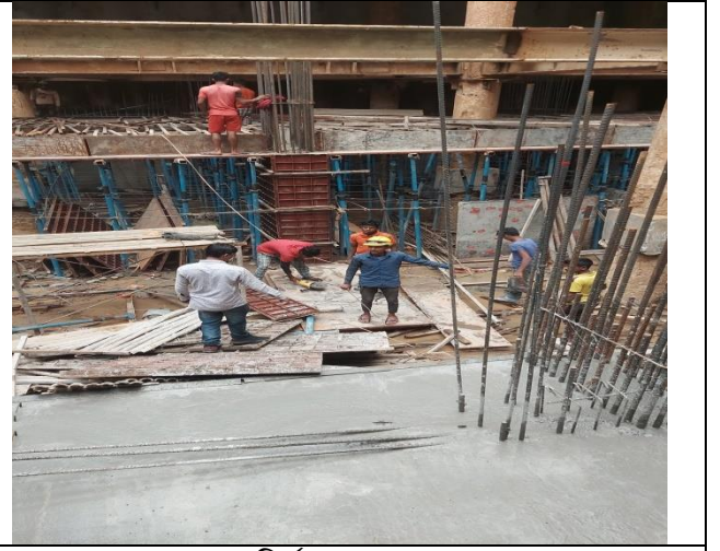
'সমাজকল্যাণ ভবন' নির্মাণের কাজ চলমান

৪.২ 'সমাজকল্যাণ ভবন' নির্মাণ কাজের আর্থিক অগ্রগতি: বহুতল বিশিষ্ট সমাজকল্যাণ ভবনের ভৌত ও আর্থিক অগ্রগতি প্রায় ২৫%। ভবন প্রকল্পের মেয়াদ জুন/২০২১ এ উত্তীর্ণ হয়ে যাওয়ায় কিছু শর্ত সাপেক্ষে এ প্রকল্পের মেয়াদ ২ বছর অর্থাৎ ৩০ জুন/২০২৩ পর্যন্ত বর্ধিত করা হয়েছে।