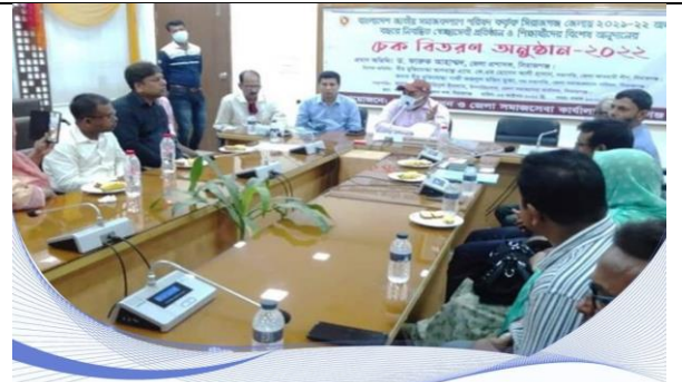
সিরাজগঞ্জে স্বেচ্ছাসেবী প্রতিষ্ঠান ও শিক্ষার্থীদের মাঝে চেক বিতরণ