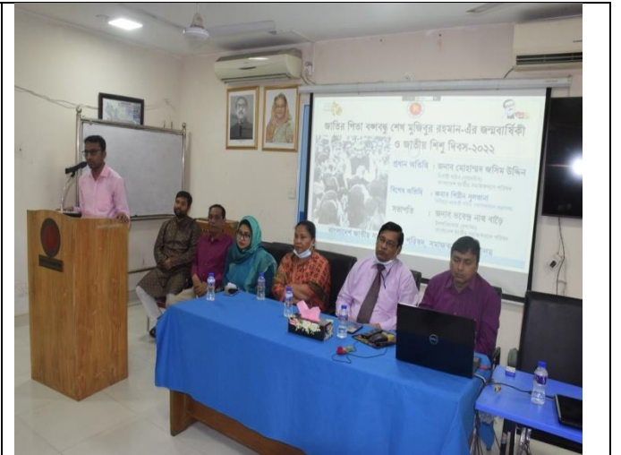
১৭.০৩.২০২২ তারিখ জাতির পিতা বঙ্গবন্ধু শেখ মুজিবুর রহমান এর জন্মশত বার্ষিকী উপলক্ষে দোয়া ও আলোচনা সভা অনুষ্ঠিত হয়।