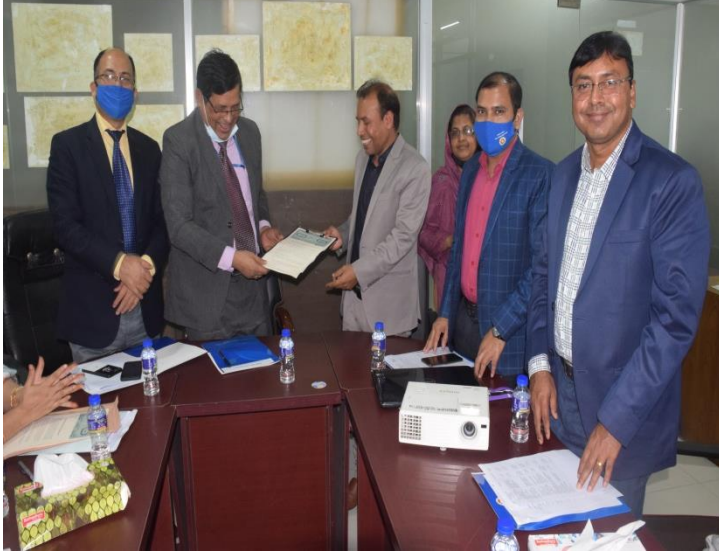
চিত্র : সাতটি গবেষণা প্রতিষ্ঠানের সাথে চুক্তিনামা স্বাক্ষরিত হয়।