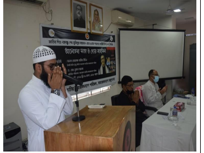
১৫.০৮.২০২১ তারিখ জাতির পিতা বঙ্গবন্ধু শেখ মুজিবুর রহমান এর ৪৬তম শাহাদত বার্ষিকীতে দোয়া ও মোনাজাত অনুষ্ঠিত হয়।