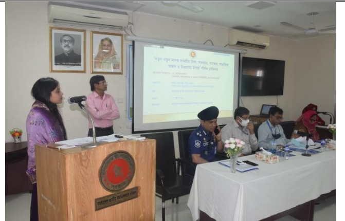
নতুন নতুন মাদক